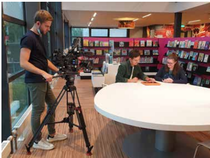
RTL 4 filmt in bibliotheek Leidschendam voor programma 'Onderweg naar de Regio'